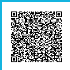
Junta municipal del distrito de Usera